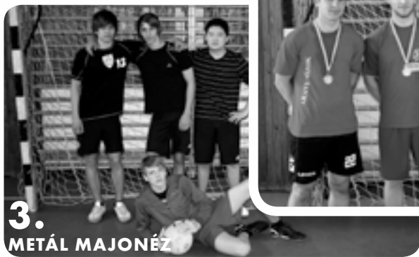
3. METÁL MAJONÉZ