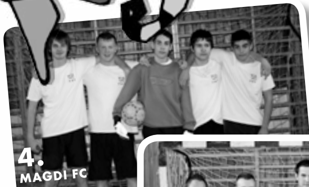
4. MAGDI FC