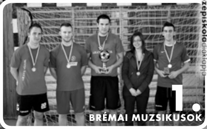
1. BRÉMAI MUZSIKUSOK